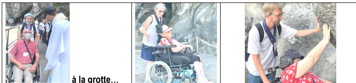
à la grotte...

du jeudi 16 au mardi 21 juin HDL Train Rose / Facebook